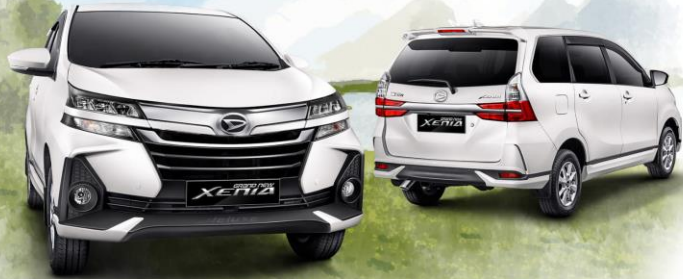
*Type 1.3 R Deluxe

Grand New Xenia baru tampil semakin istimewa. Kini bergajian ke mana saja terasa lebih membanggakan dengan desain eksterior yang lebih modern, tangguh dan sporty