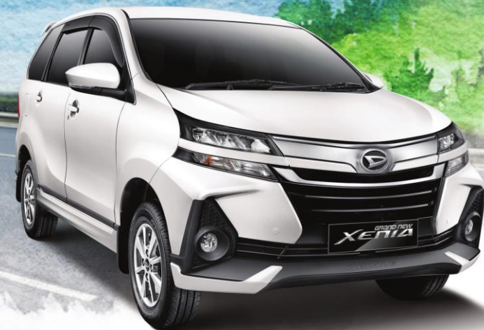
*Tipe R Sporty