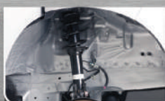
Suspensi Tipe Per Keong