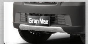
Front Skid Plate