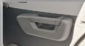
Door Arm Rest