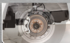
Ventilated Disc Brake