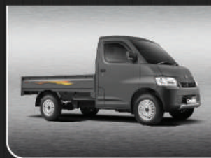
Rock Grey Metallic