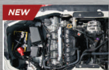
1.5L DOHC Dual VVTi