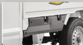
Side Guard Cover