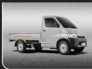
Classic Silver Metallic