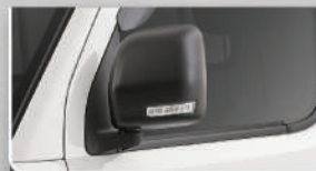
Side Turn Lamp