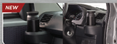
2 Cup Holder