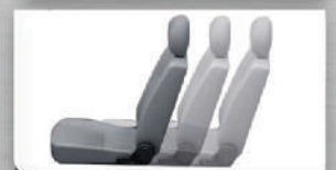
Front Sliding Seat (Driver)