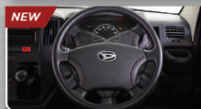
Electric Power Steering (1.5 L)